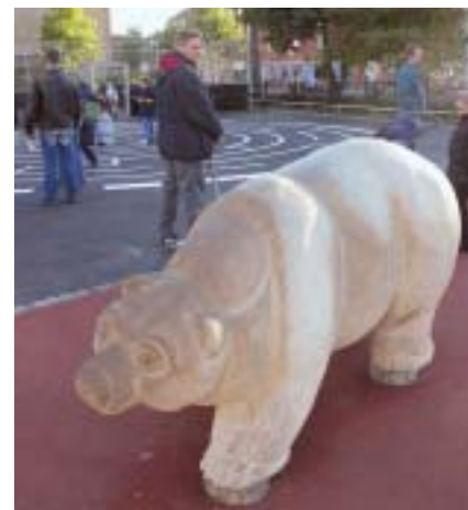
Billedet er fra legepladsen "Østen for Solen, vesten for Månen". Læs artiklen side 6-7

for produktsikkerheden hos et af de største firmaer i branchen har han deltaget i standardiseringsprocessen siden 1982 og har rejst verden rundt med foredrag og seminarer. Han er en af initiativtagerne til den første danske standard for legepladssikkerhed og har deltaget i CEN forhandlingerne, senest som dansk delegationsleder. Han har siden årsskiftet haft sin egen konsulentvirksomhed under navnet "LegeStafetten". E-mail: mtj@LegeStafetten.dk